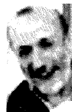
«LOCALE» Nella foto Carlo Petrini, fondatore di Slow Food: «La parola chiave per migliorare è: "locale"»

Chi può intervenire e non lo fa è come se fosse nei panni di Chaplin e azionasse da solo la sua eating machine : continuando così il risultato sarà ben più drammatico di una banale, ma pur sempre comica, torta in faccia.